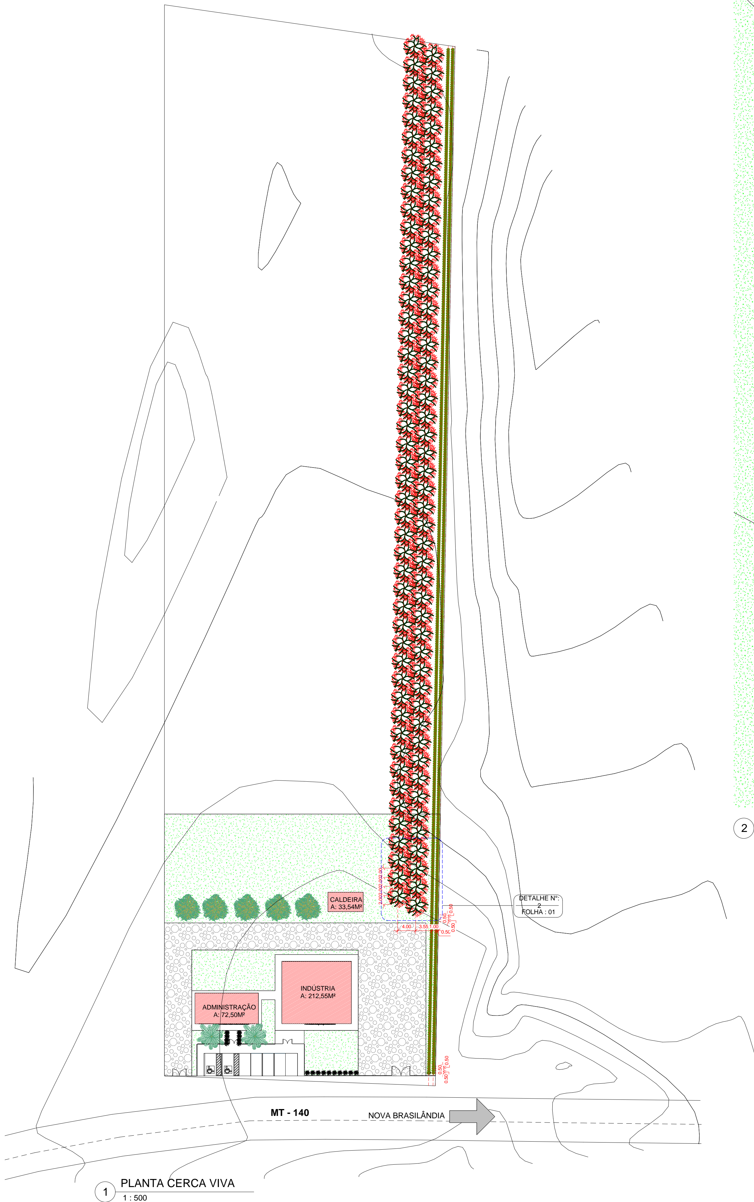
1 PLANTA CERCA VIVA 1 : 500